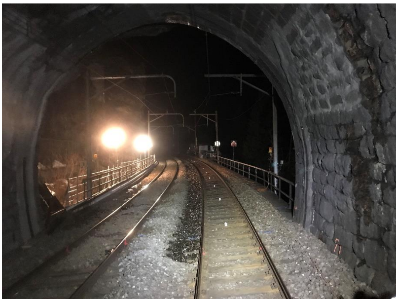
Vue de l'application