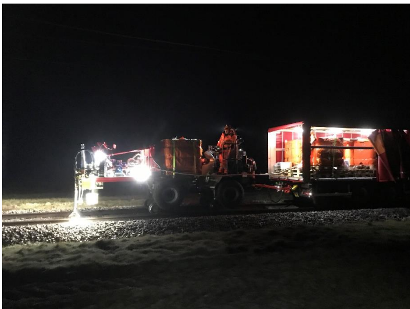
Vue de l'exécution de l'application