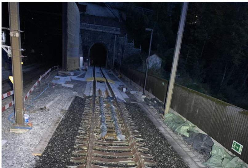
Vue du collage de ballast