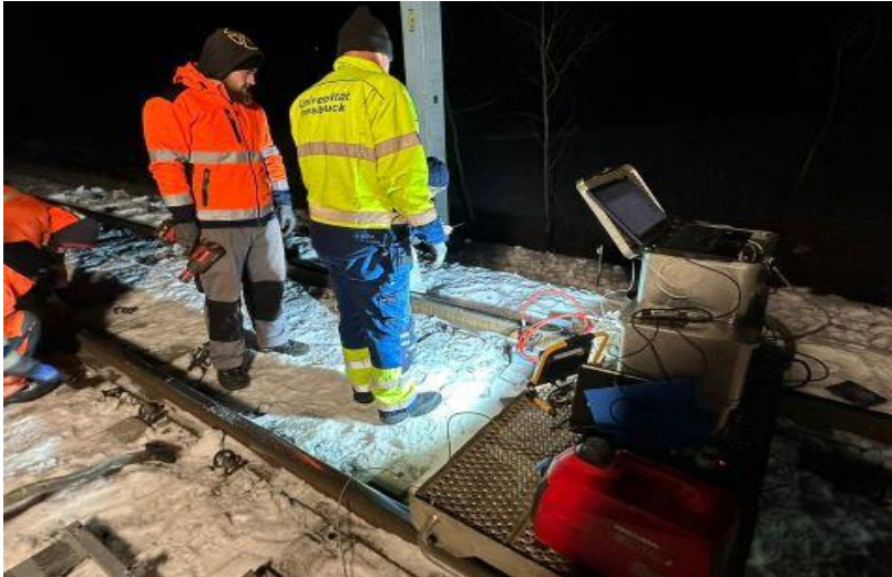
Ansicht auf Prüfeinrichtung