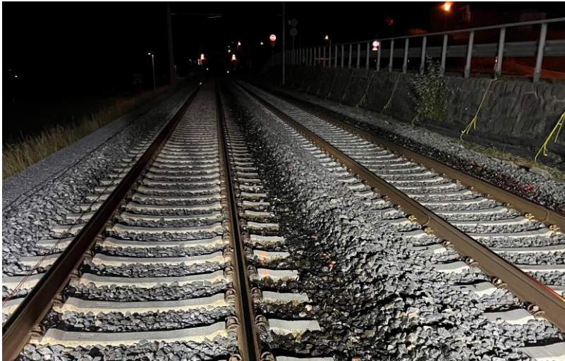
Ansicht auf die Verklebungen