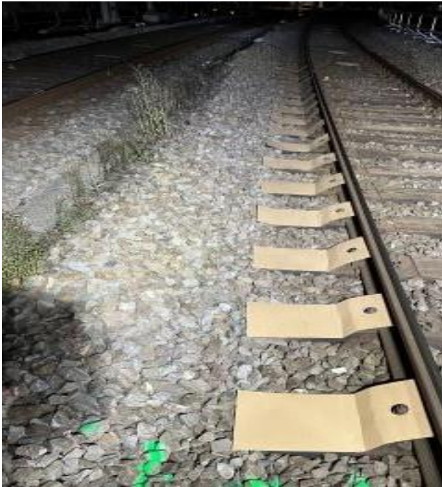
Ansicht vor der Verklebung mit abgedeckten Schwellköpfen