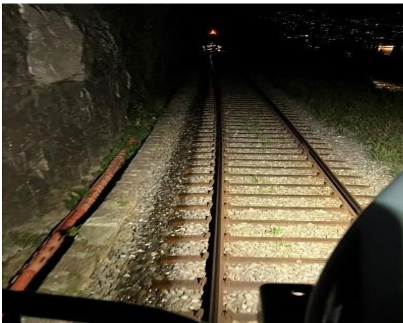
Ansicht vor der Verklebung mit abgedeckten Schwellköpfen