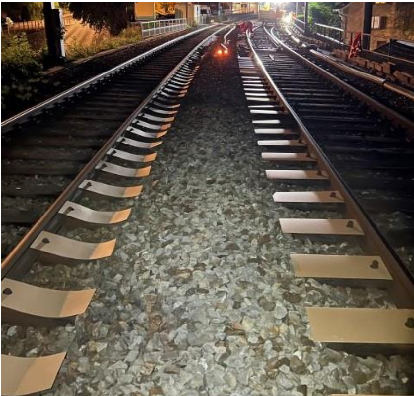
Blick auf die zu Verklebenden Bereiche inkl. Schwellenkopfabdeckung