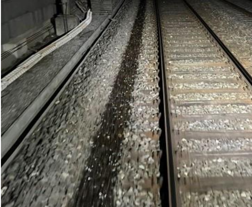
Ansicht auf die Applikation