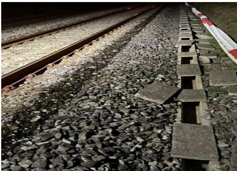
Ansicht auf die fertige Applikation