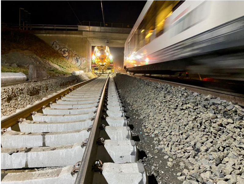
Ansicht auf die Verklebung