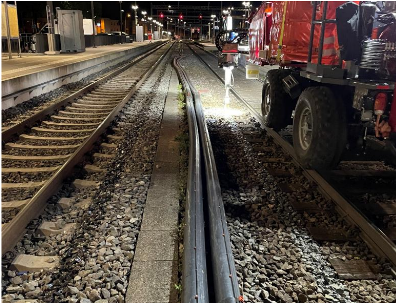
Ansicht auf die Ausführung Applikation