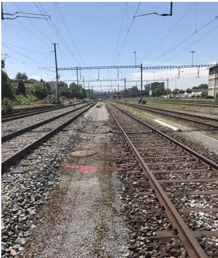
Ansicht auf den zu Verklebenden Abschnitt für die Mittenentwässerung