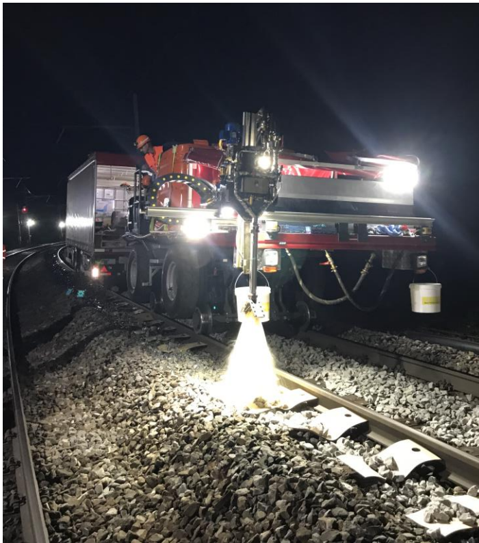
Ansicht auf die Schotterverklebungsanlage mit Anhänger