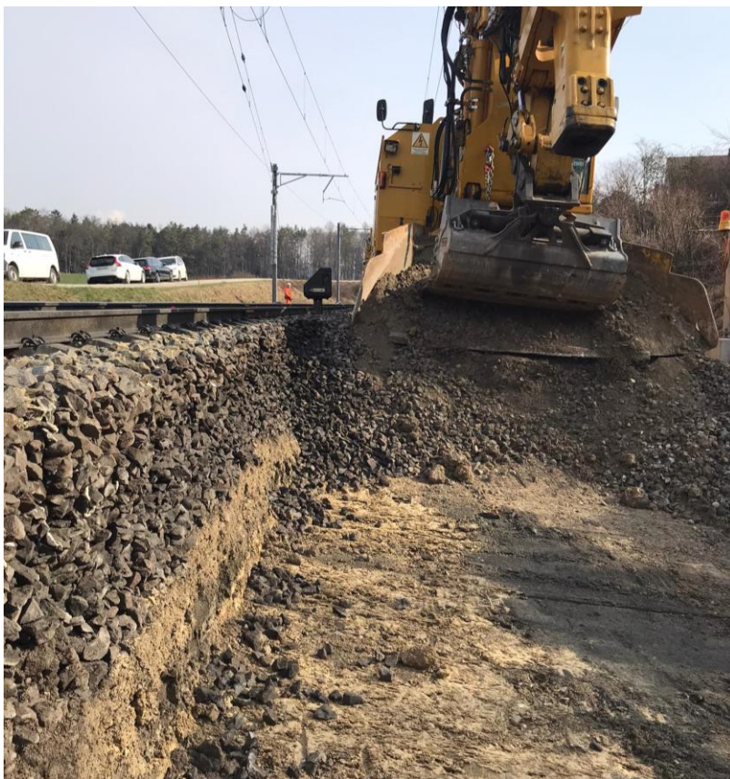
Ansicht auf die freigelegte Schotterverklebung