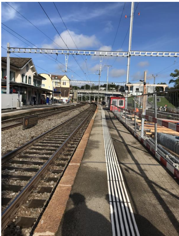
Ansicht auf das Perron