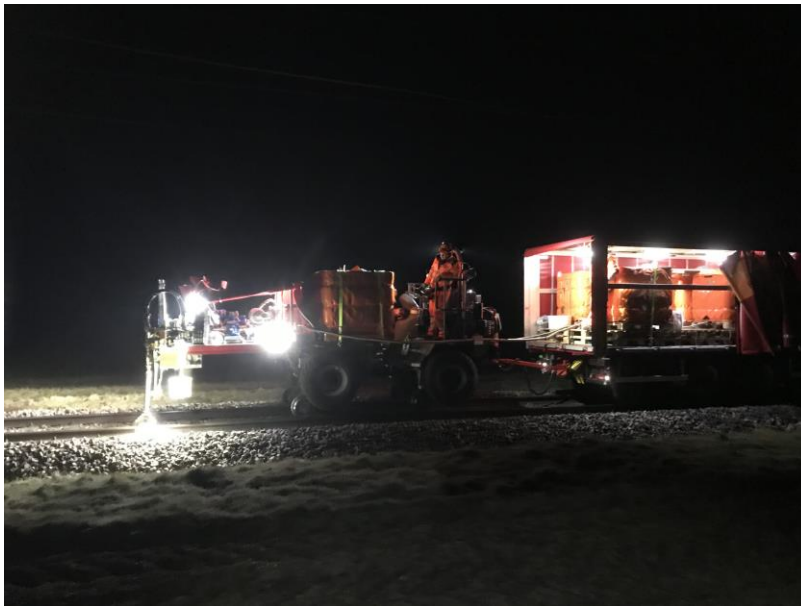
Ansicht auf die Ausführung Applikation